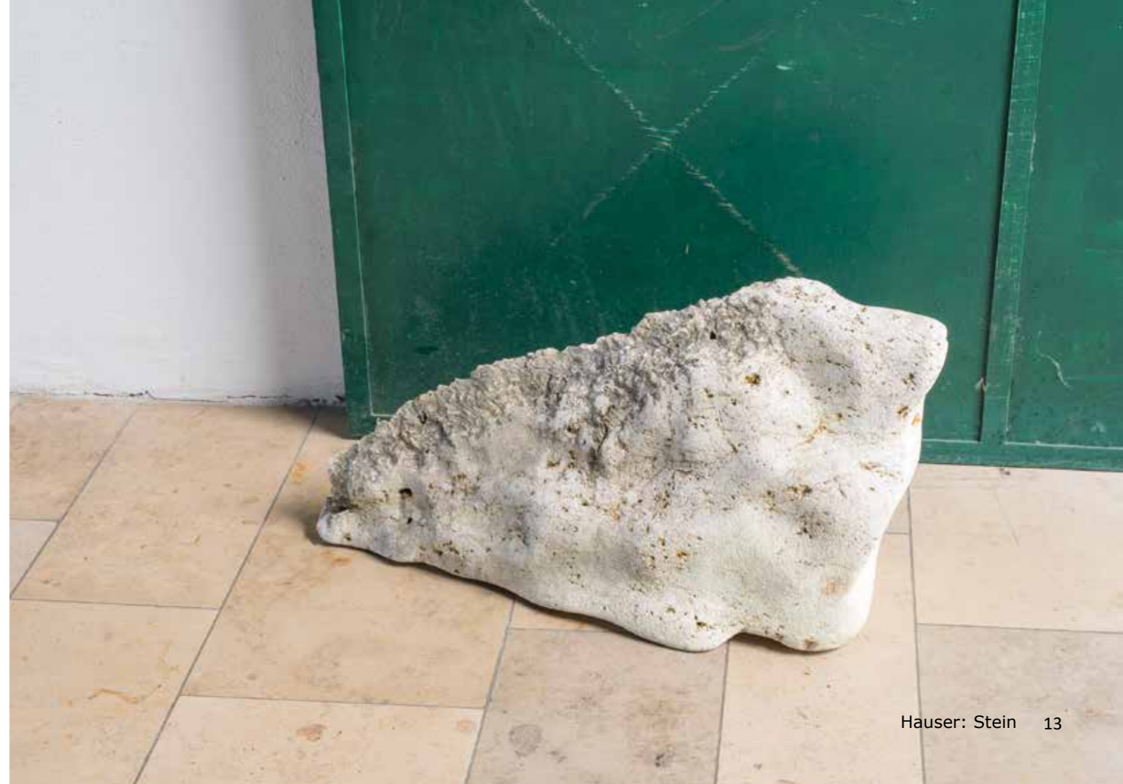
Hauser: Stein 13