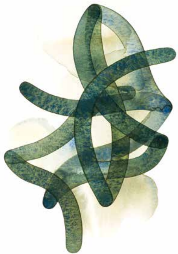
8 Geitel: Knäuel-Block II, Aquarelle