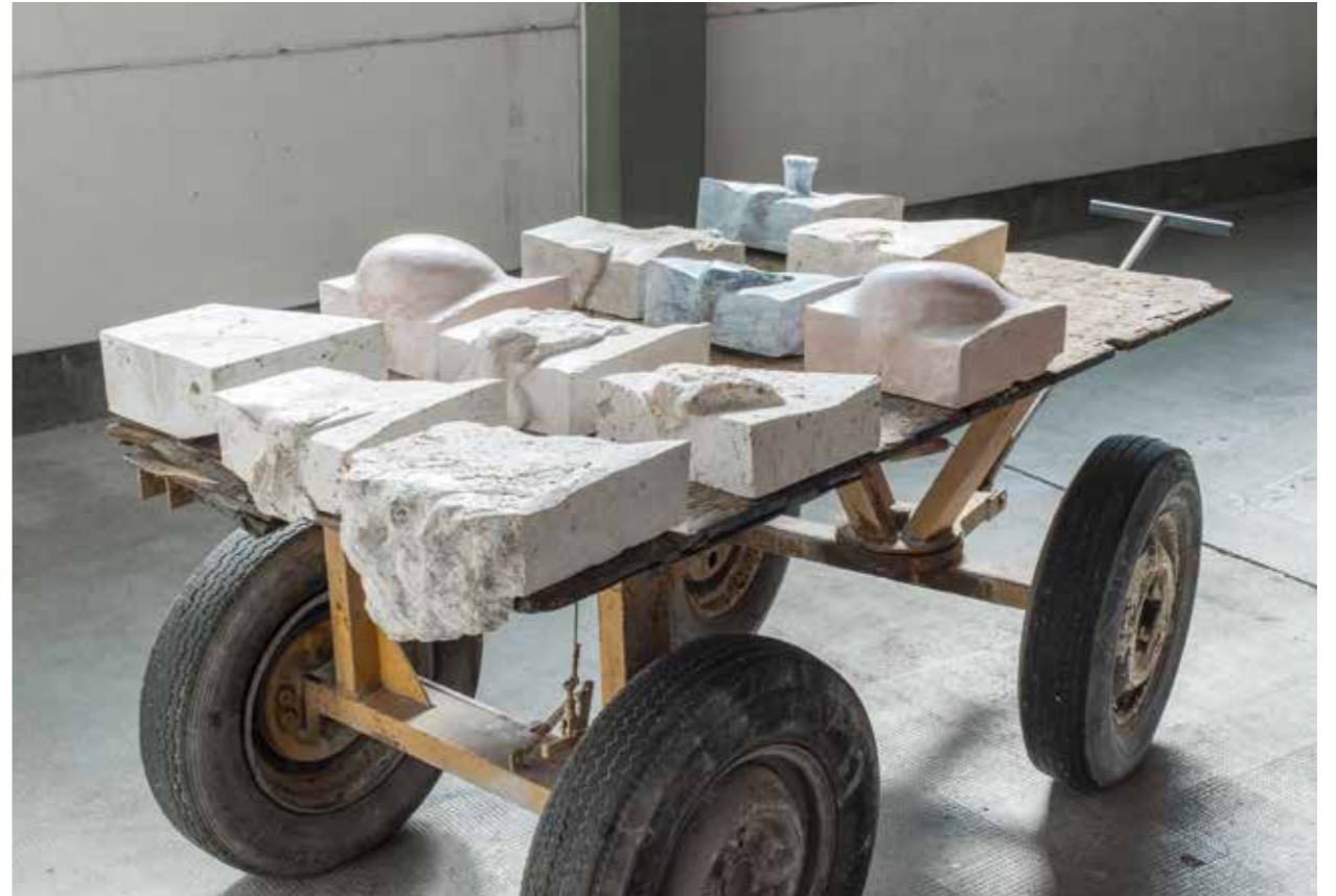
Hauser: Wagen und Steine 15