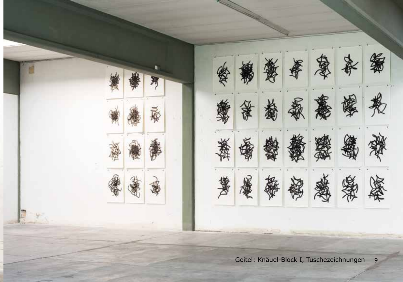
Geitel: Knäuel-Block I, Tuschezeichnungen 9