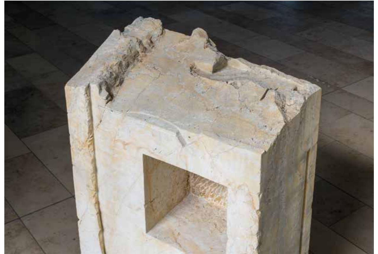
Hauser: Pult 23