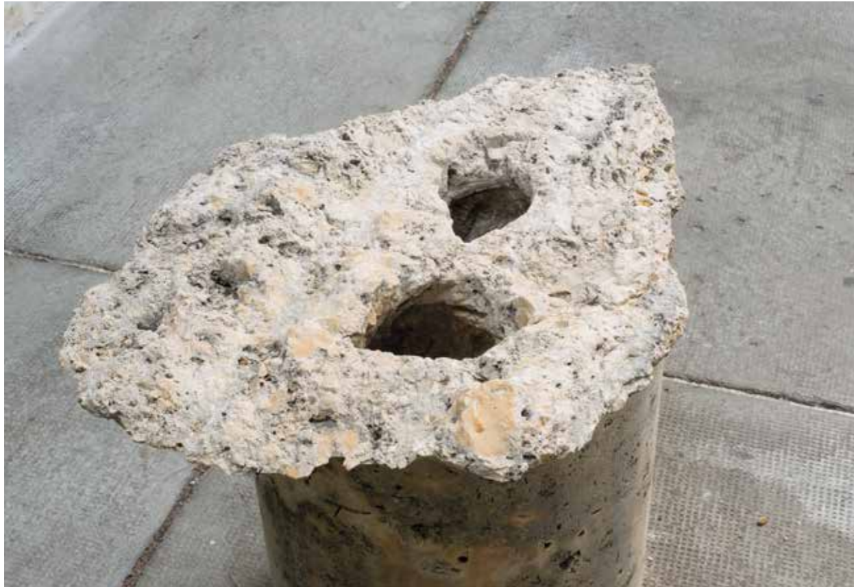
20 Hauser: Augenstein