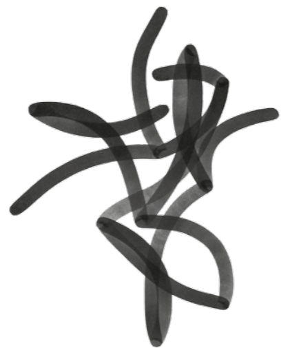
12 Geitel: Knäuel, Tuchezeichnungen