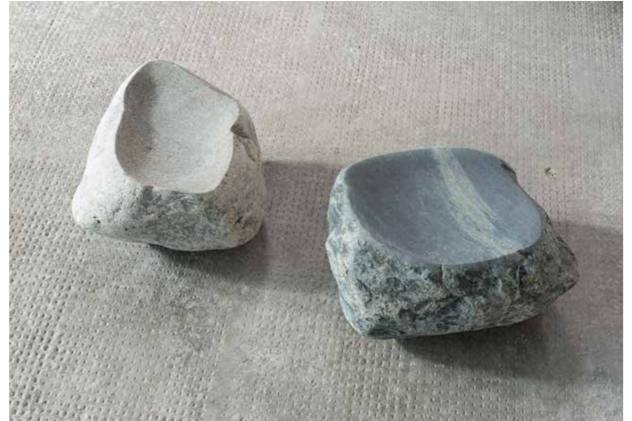
Hauser: Muldensteine 21