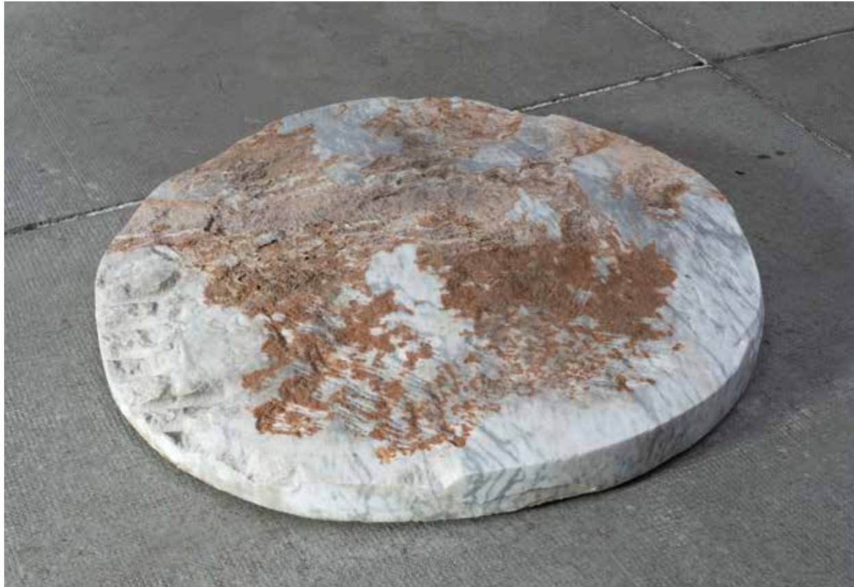
22 Hauser: Marmorscheibe